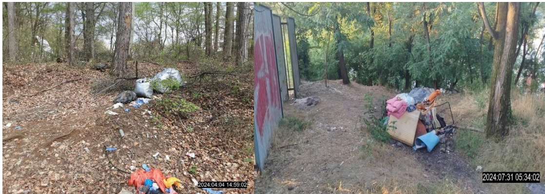
Obr. 4 Zistenie umiestnenia skládky

Príslušníci MsP Sever v rámci služby ochrany životného prostredia zisťovali a riešili držiteľov alebo vlastníkov starých opustených motorových vozidiel, pričom v sledovanom období zistili 55 starých vozidiel, z toho 47 vozidiel sa podarilo následne činnosťou stanice v priebehu roka 2024 odstrániť. Z toho 38 majiteľov starých vozidiel si vozidlo odstránilo po našej výzve samostatne, 4 držiteľia si po našej výzve obnovili EK a TK a 5 vozidla boli spracované autorizovanou firmou, ktorá sa zaoberá likvidáciou a spracovaním starých vozidiel.