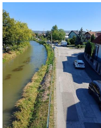
Obr.3. Zistenie umiestnenia skládky stavebného odpadu s využitím fotopasce

Okrem toho environmentálna hliadka MsP Sever vlastnou činnosťou v roku 2024 zistila 8 skládok stavebného, zmiešaného a komunálneho odpadu, ktoré sa podarilo v spolupráci so zamestnancami MÚ MČ Sever odstrániť. Skládky najväčšieho rozsahu, ktoré boli príslušníkmi zistené boli v lokalite za amfiteátrom, v oblasti Čermel'ské prielohy a v lese pred vyhliadkovou vežou smer Kavečany.