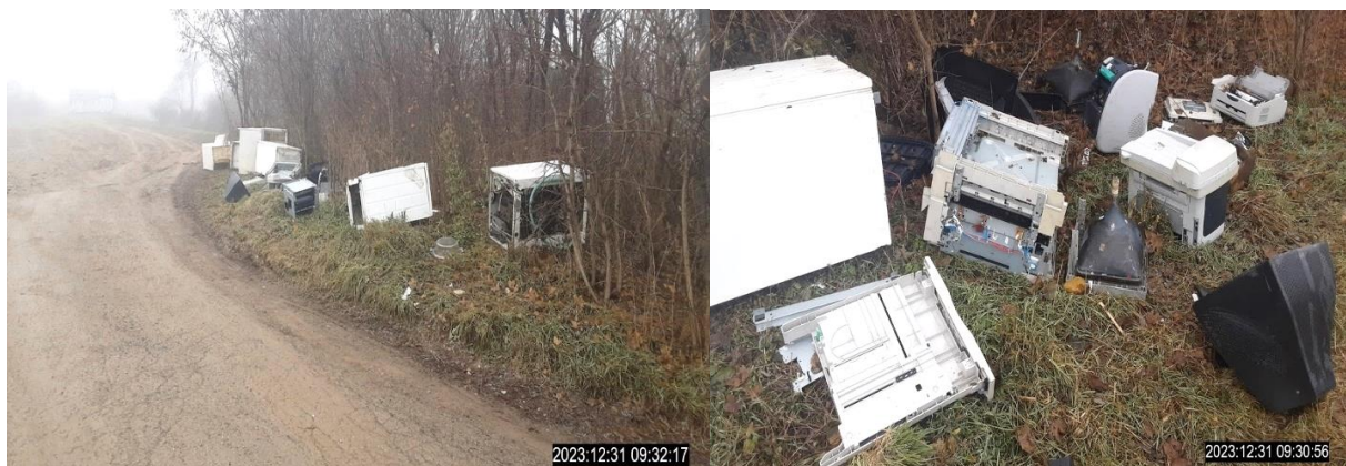
Obr.1. Zistená skládka elektroodpadu v mesiaci január 2024

Environmentálna hliadka zo stanice MsP Sever v mesiaci január 2024 zistila a zadokumentovala nezákonné uloženie elektro-odpadu a iného odpadu na parcele č. C 6978/1 v katastrálnom území Severné mesto na ul. Žľaby č.9 v Košiciach, z ktorého bol v tom čase podozrivý neznámy páchatel' podľa zákona o odpadoch. MsP však nemá zákonné oprávnenie na objasňovanie a prejednávanie týchto priestupkov. Z tohto dôvodu príslušníci MsP po zistení uvedenej skládky prípad zadokumentovali a následne v súlade so zákonom oznámili vecne príslušnému správne mu orgánu, ktorým je v tomto prípade Okresný úrad Košice - Odbor starostlivosti o životné prostredie k ďalšej realizácii. Z dôvodu rozsahu znečistenia bola o danej veci informovaná envirohliadka odboru kriminálnej polície.