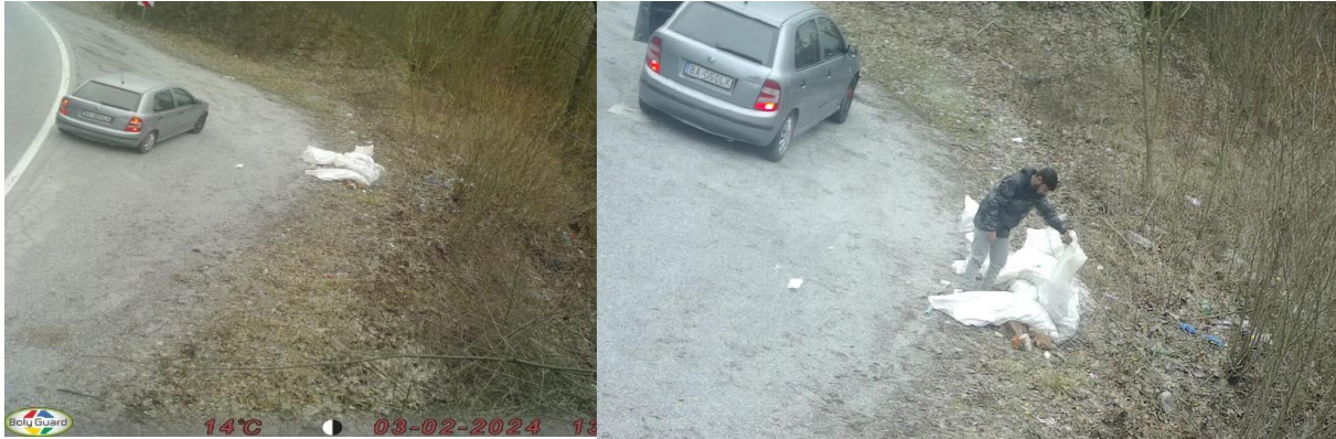
Obr.2. Zistenie umiestnenia skládky stavebného odpadu s využitím fotopasce

Príslušníci stanice MsP Sever v rámci prevencie a zabráneniu rozrastania skládok využili fotopasce aj na ul. Ťahanovské riadky, kde bol environmentálnou hliadkou zistený vysypaný stavebný materiál o rozmeroch 15 x 2m a umiestnený neznámou osobou na brehu Mlynského náhonu.